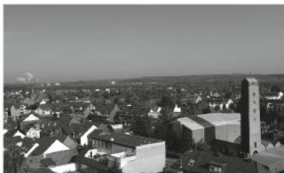
Blick von oben mit Unterstützung der Feuerwehr