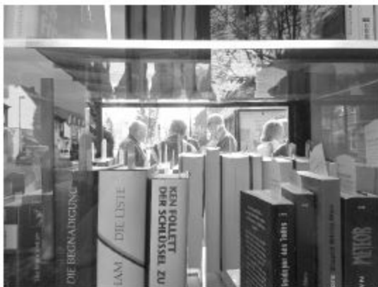
Foto: Der Bücherschrank wartet auf neue Patinnen/ Paten...

Sicherlich haben Sie auch schon den eckigen Kasten aus Metall und Glas neben der Haltestelle Neue Kirche wahrgenommen. Das ist der neue